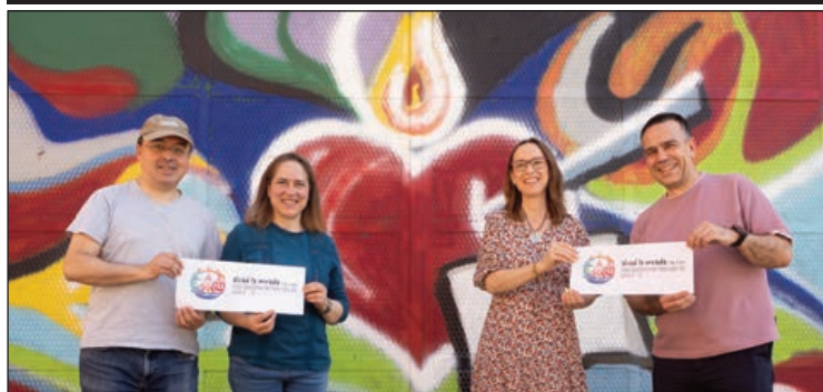
Familias de Agustinas. De fondo, el corazón, la flecha y el libro, símbolos agustinianos