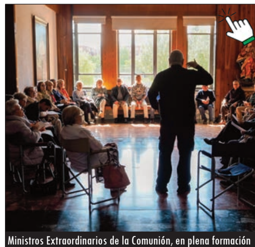
Ministros Extraordinarios de la Comunión, en plena formación