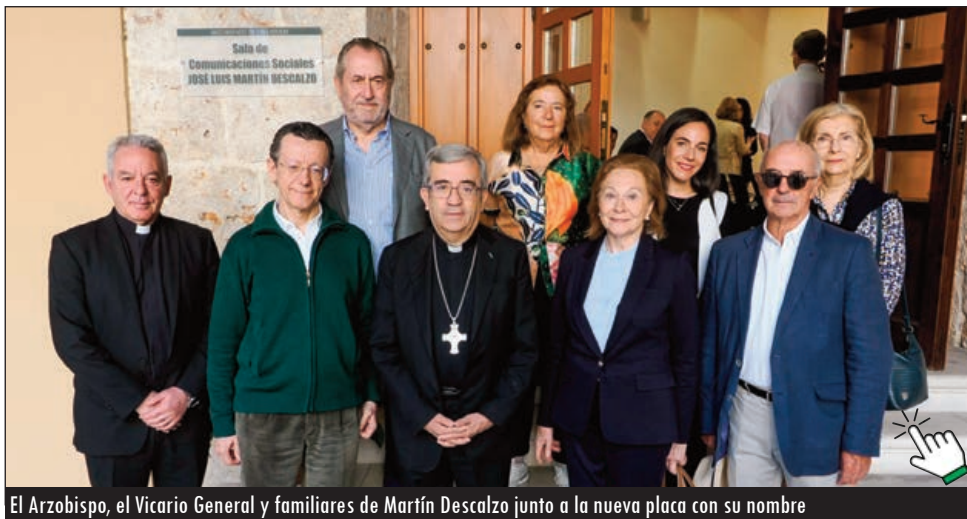
El Arzobispo, el Vicario General y familiares de Martín Descalzo junto a la nueva placa con su nombre

El Arzobispado de Valladolid acogió el viernes 22 de mayo, en el marco de la Jornada Mundial de las Comunicaciones Sociales que la Iglesia celebró el pasado 17 de mayo coincidiendo con la Solemnidad de la Ascensión del Señor, un acto para presentar la reciente reforma de su sala de prensa que, desde ese día, lleva por nombre el de Sala de Comunicaciones Sociales José Luis Martín Descalzo (1930-1991), en recuerdo del sacerdote, periodista y escritor de raíces vallisoletanas.