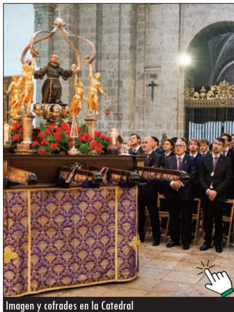
Imagen y cofrades en la Catedral

Recordando los votos que profesó San Pedro Regalado como fraile franciscano, monseñor Argüello puso en relación la pobreza, la castidad y la obediencia con algunos asuntos de hoy: la vivienda, las relaciones laborales, el matrimonio o