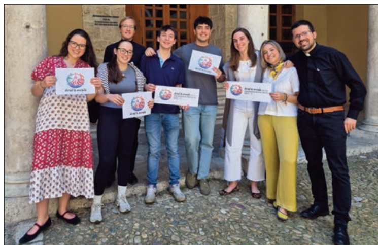
Jóvenes, sosteniendo el logo y el lema del viaje apostólico

importante, que es escuchar al Papa”. “Es una pasada”, afirma, “porque es el primer concierto al que nosotros vamos, pero no somos a los que nos van a ver, vamos todos a escuchar lo que dice él (el Santo Padre)” y “eso es de las cosas más bonitas”, a ojos de Robles, consciente de que esta es una oportunidad única en su carrera: “Sabemos que esto no lo vamos a repetir en nuestra vida”.