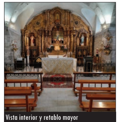
Vista interior y retablo mayor

Castrodeza tenía una deuda pendiente con su patrona, Nuestra Señora