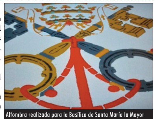
Alfombra realizada para la Basílica de Santa María la Mayor

En Castrodeza las ha realizado durante más de 30 años de forma ininterrumpida en honor a San Miguel Arcángel. Igualmente, en su otro pueblo, Viana de Cega, además de en Arroyo de la Encomienda, Mata-pozuelos, Robladillo... Amén de ser invitado por el Vaticano a la Basílica de Santa María la Mayor de Roma el día del 'Corpus Christi' o también a la Plaza Cibeles de Madrid, donde desplegó una alfombra floral en la JMJ de 2011, última visita papal a España hasta la que León XIV realizará este mismo mes de junio.