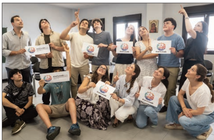
La Unidad Pastoral Santiago-Salvador, alzando la mirada