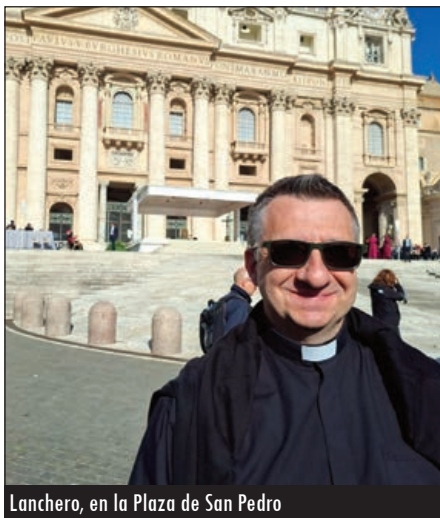
Lancho, en la Plaza de San Pedro

Lancho subraya la importancia de esta formación “muy recomendable”, apunta, “para