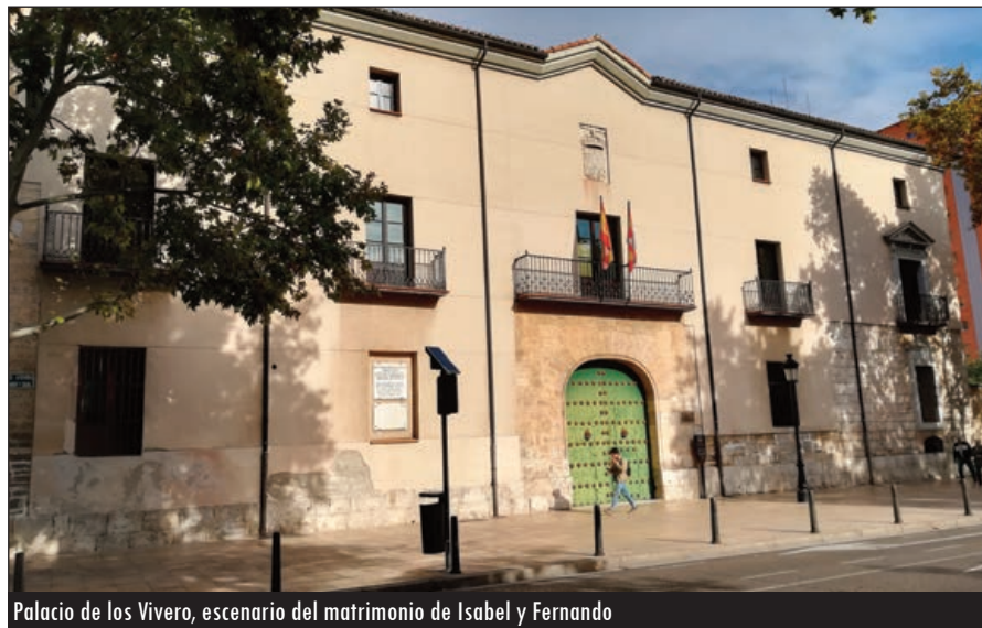
Palacio de los Vivero, escenario del matrimonio de Isabel y Fernando

A finales de 1468, Isabel estaba "decidida" por su pariente aragonés, pero las negociaciones y las capitulaciones matrimoniales fueron secretas, como el lugar