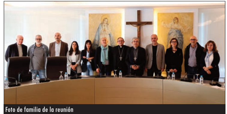
Foto de familia de la reunión

insidiosa la que sugiere que toda persona deba ganarse o justificar su propio valor, hasta el punto de atribuir mayor valía a quienes son más eficientes y productivos. En semejante perspectiva, la persona termina reduciéndose a un medio para obtener resultados, a un recurso para ser usado y explotado, y no es reconocida como fin en sí misma, jamás instrumentalizable". Y añade que "sostener a las familias y a los jóvenes en esta transición requiere medidas que hagan posible la estabilidad".