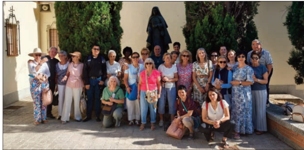
El pasado 17 de junio trabajadores y voluntarios del Centro Diocesano de Espiritualidad peregrinaron al Cerro de los Ángeles para celebrar el fin de un nuevo curso. Estuvieron acompañados por el director del Centro

E l Santuario Nacional de La Gran Promesa fue inaugurado en el año 1941 y el 12 de mayo de 1964 el Papa Pablo VI concedió al templo el título de Basílica menor. El Centro Diocesano de Espiritualidad (CDE) se constituyó el 28 de septiembre de 1994 como un lugar de acogida, descanso, oración y formación, donde encontrarse con Dios, con uno mismo, con los demás. Ambos son lugares de paz en el corazón de Valladolid.