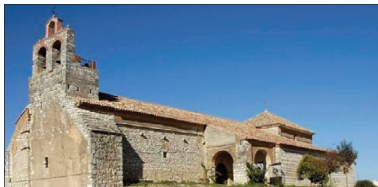
Vista exterior de la Iglesia

Igualmente, cuenta con una brillante imaginería, que se aprecia perfectamente en el retablo colateral del lado de la Epístola, donde se encuentra la buena escultura de San José con el Niño. Aparte del mismo, destaca también otra escultura tan didáctica como tierna, donde vemos a Santa Ana enseñando a leer a su pequeña hija, la Virgen Niña. Ambas esculturas y el retablo citado corresponden a mediados del siglo XVIII y, a su vez, se ajustan al estilo y características del