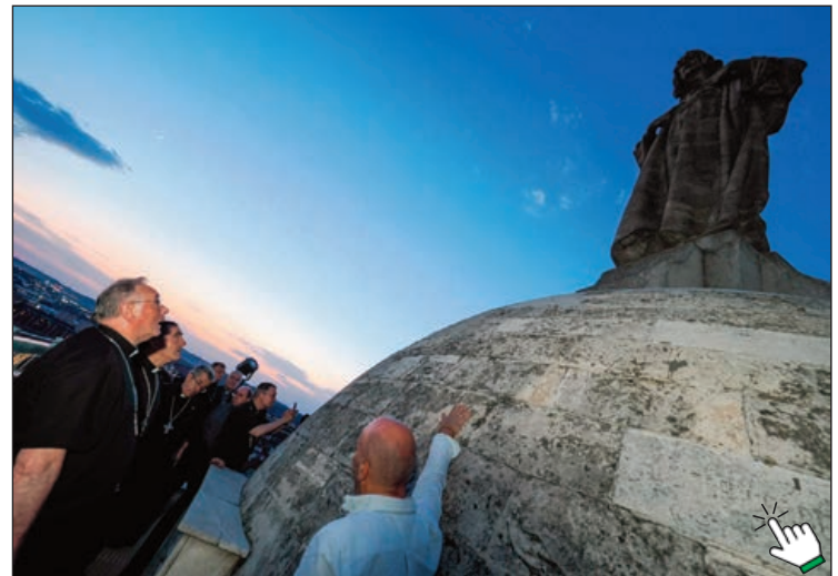
Los obispos, en el mirador de la torre de la Catedral que corona el Corazón de Jesús