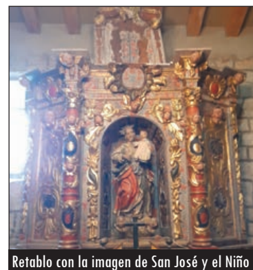
Retablo con la imagen de San José y el Niño