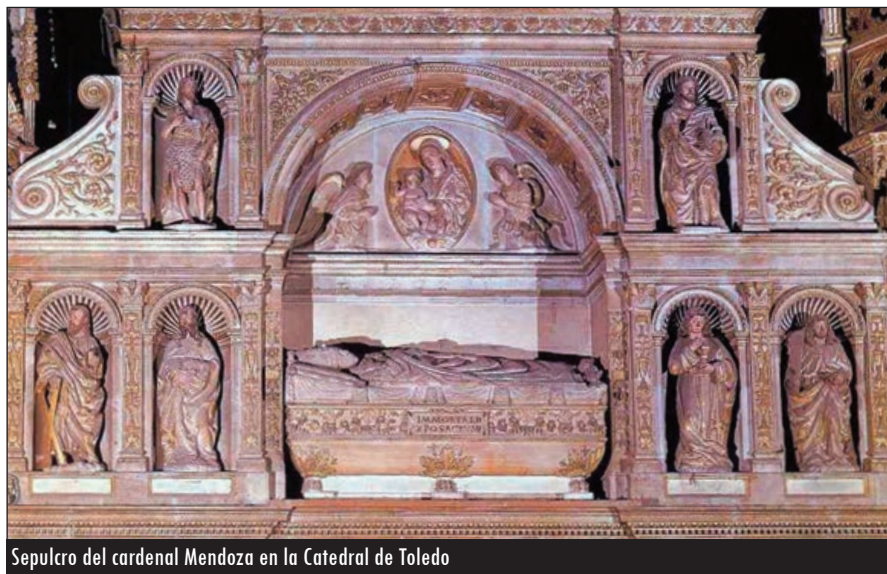
Sepulchro del cardenal Mendoza en la Catedral de Toledo

Hacíamos, en la pasada entrega, referencia a esta carta que te habrá costado comprender su transcripción. Forma parte del Archivo catedralicio de Valladolid y estuvo en la exposición ‘Testigos’, de Las Edades del Hombre de Ávila, ocasión para la cual