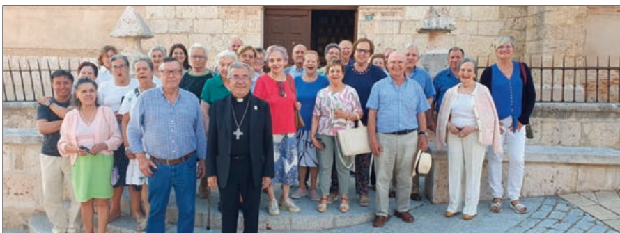
Mons. Argüello junto a los fieles durante una de sus dos visitas a Villalar de los Comuneros

B enafarces, Pedrosa del Rey, San Cebrián de Mazote y Villalar de los Comuneros. Cuatro pueblos en una sola tarde. Es solo un ejemplo de la intensa agenda del Arzobispo de Valladolid, monseñor Luis Argüello, durante su visita pastoral al Arciprestazgo de Campos, el más grande, tanto en superficie geográfica como en número de parroquias —87—, de los nueve arciprestazgos en los que se divide la Archidiócesis.