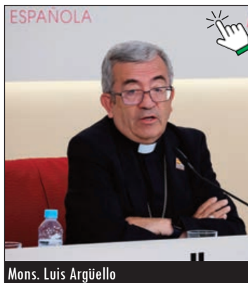
Mons. Luis Argüello

“¿A qué se debe?”, recogió el guante el presidente de los obispos españoles, que siguió lanzando pre-