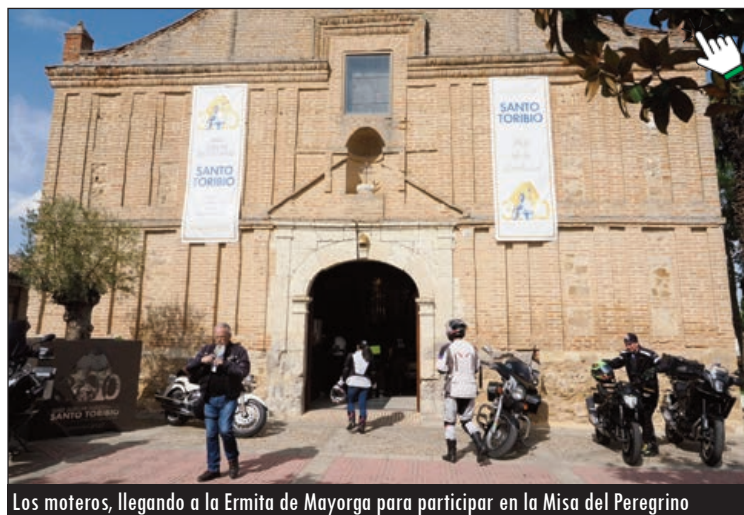
Los moteros, llegando a la Ermita de Mayorga para participar en la Misa del Peregrino

Desde el centro de Valladolid pusieron rumbo, primero, a Urueña,